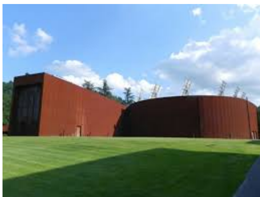
Figura 1 – Centro Congressi di Acqui Terme veduta esterna