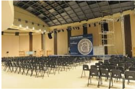
Figura 2 – Centro Congressi di Acqui Terme veduta interna

Le aree interessate sono chiaramente evidenziate nella sottoindicata planimetria.