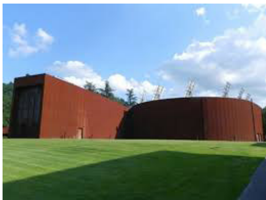
Figura 1 – Centro Congressi di Acqui Terme veduta esterna