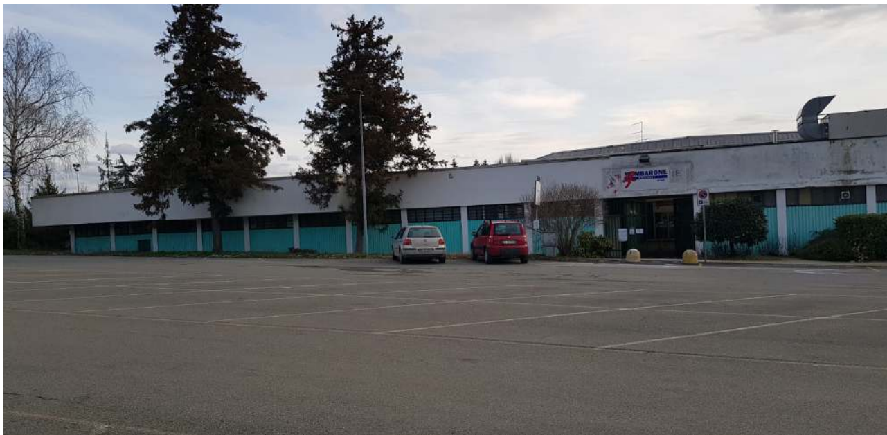
Figura 4. Centro Polisportivo Mombarone. Veduta esterna

Durante le prove sarà presente personale sanitario con defibrillatore.