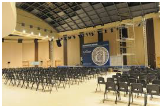
Figura 2 – Centro Congressi di Acqui Terme veduta interna

Le aree interessate sono chiaramente evidenziate nella sotto indicata planimetria.