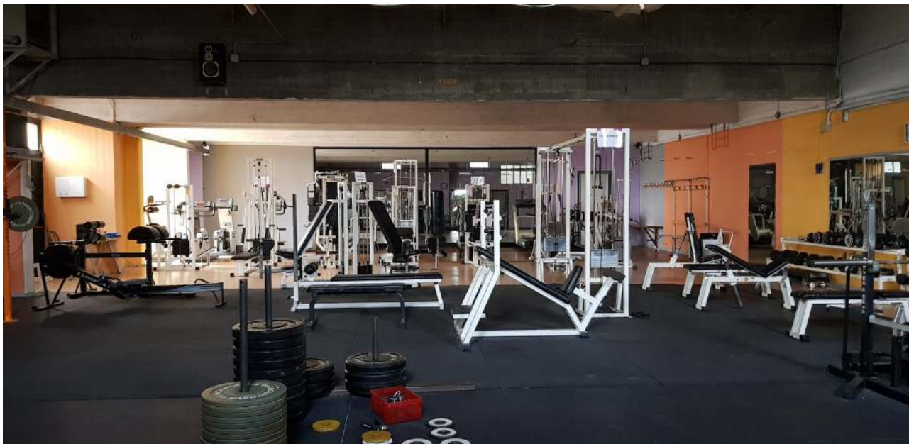
Figura 5. Centro Polisportivo Mombarone. Veduta interna: palestra