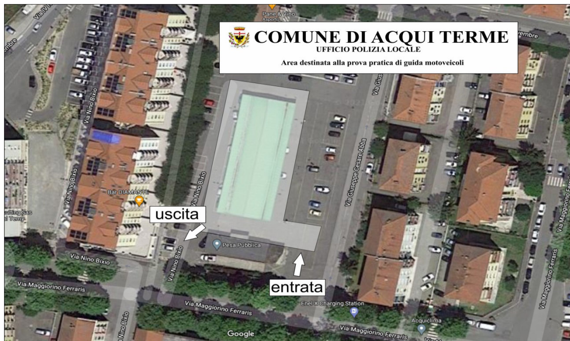
Figura 7. veduta dall'alto area concorsuale prova di agilità con la moto

I candidati dovranno presenti adeguatamente vestiti, OBBLIGATORIAMENTE, A PENA DI ESCLUSIONE MUNITI DI CASCO PROPRIO e se ritengono potranno indossare altre proprie dotazioni non obbligatorie per l'espletamento della prova (guanti, giubbotto, para schiena, ecc.).