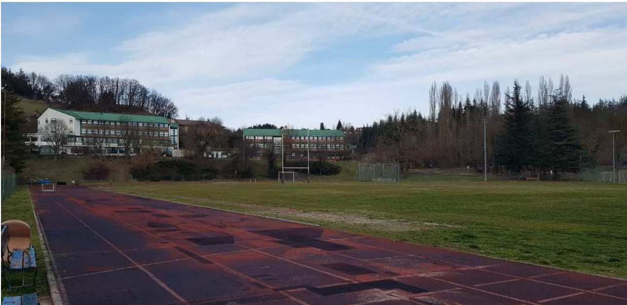
Figura 6. Centro Polisportivo Mombarone. Veduta interna: pista di atletica