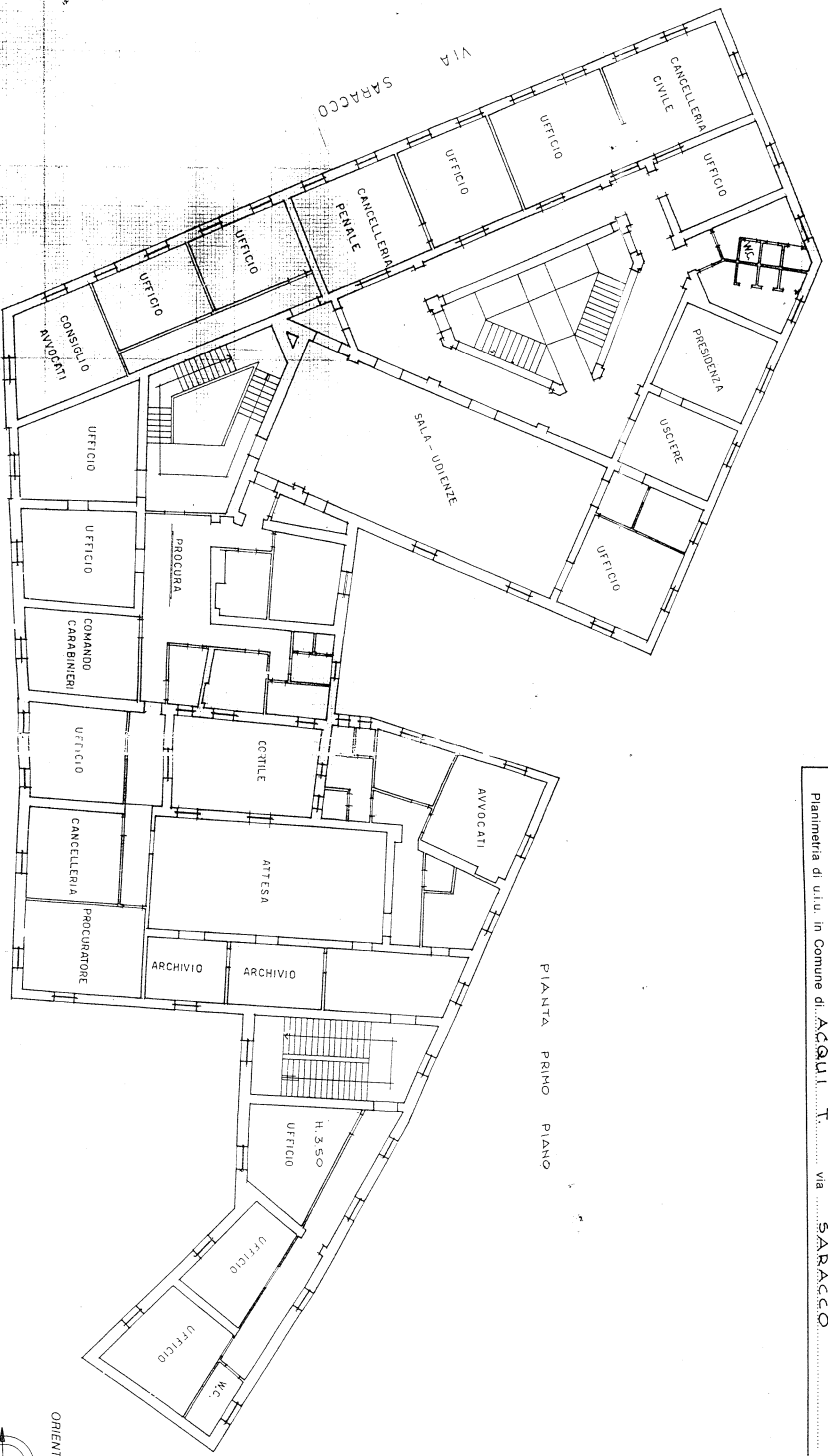
PIANTA PRIMO PIANO

Planimetria di u.i.u. in Comune di ACQUA T. via SARACCO civ. 12