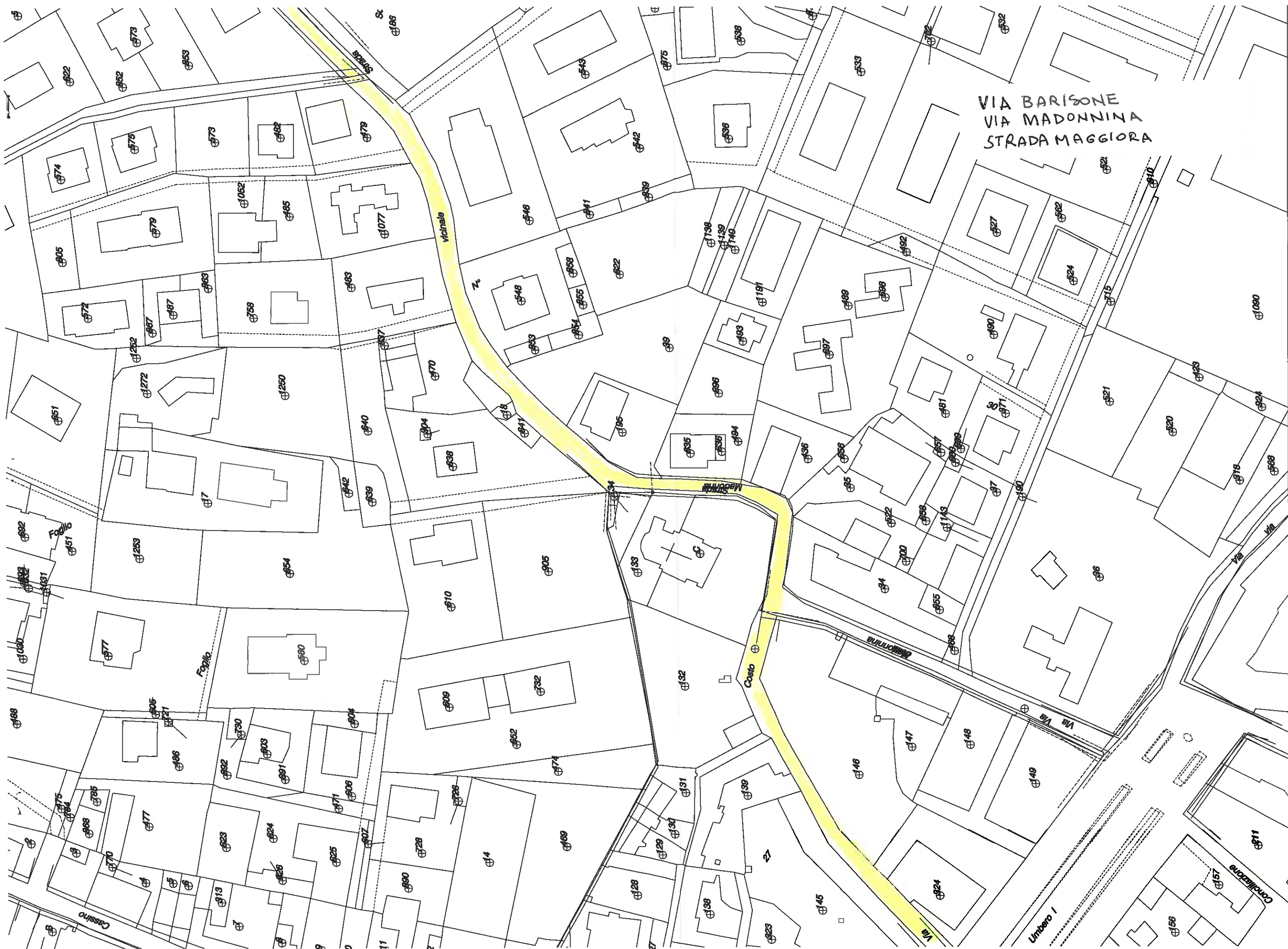
Planimetria Catastale - Scala 1:1000