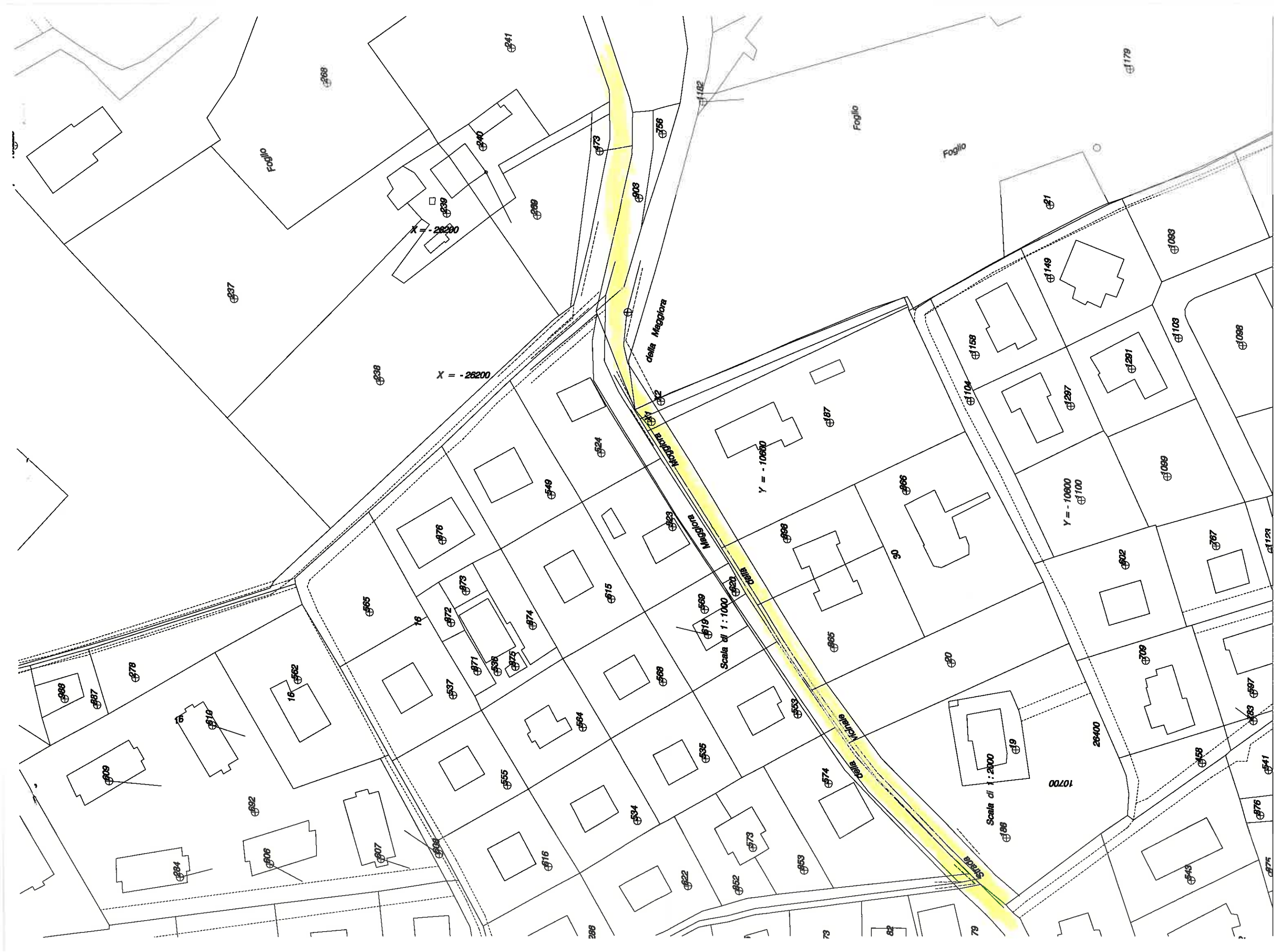
Planimetria Catastale - Scala 1:1000