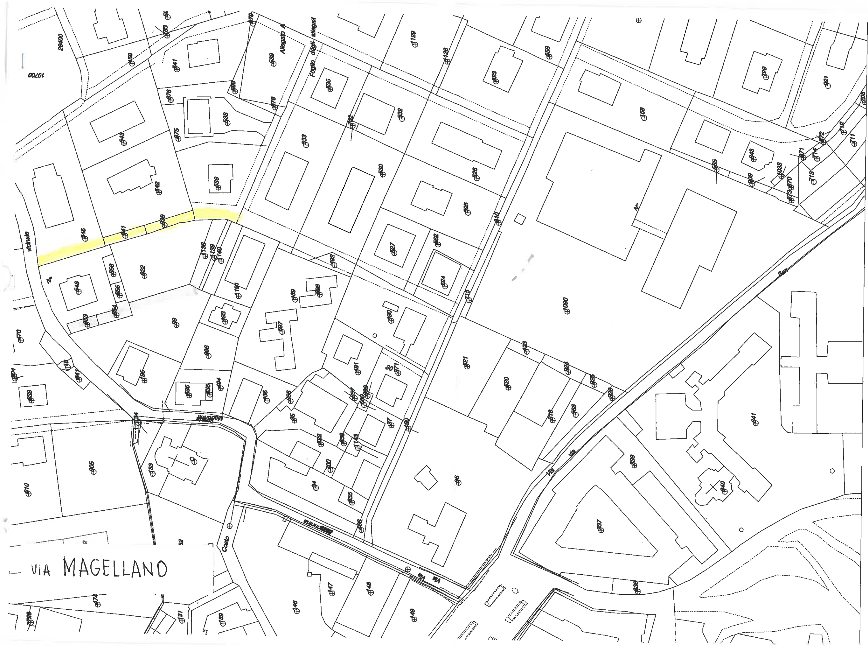
Planimetria Catastale - Scala 1:1000