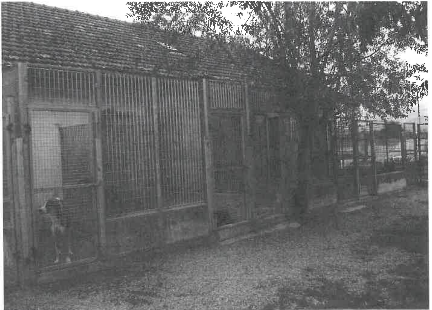
Zona box da spostare.