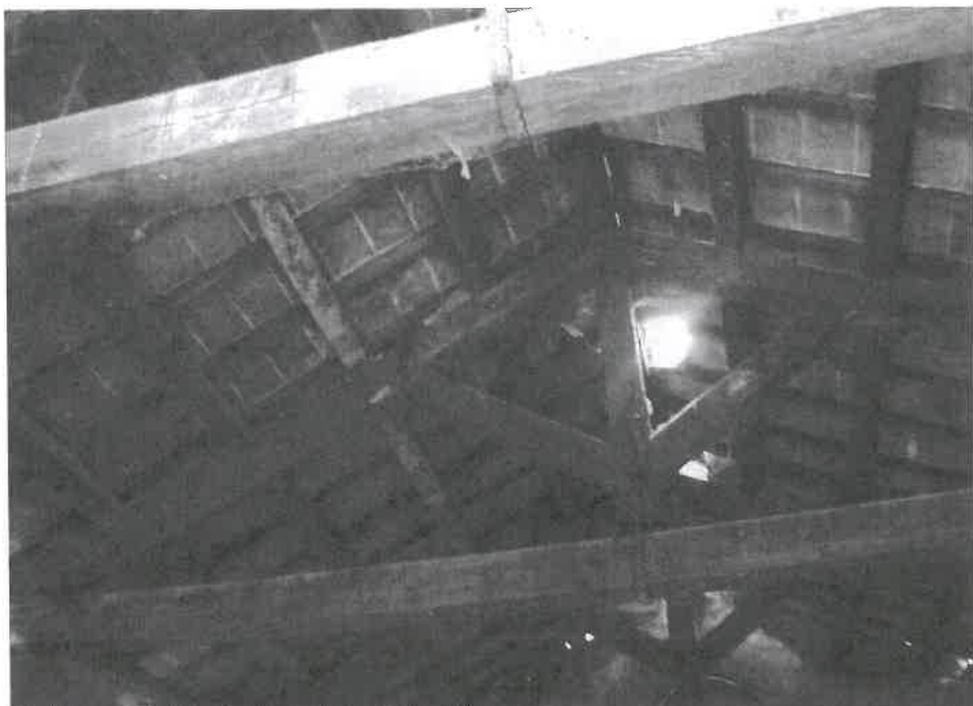
Interno fabbricato da ristrutturare