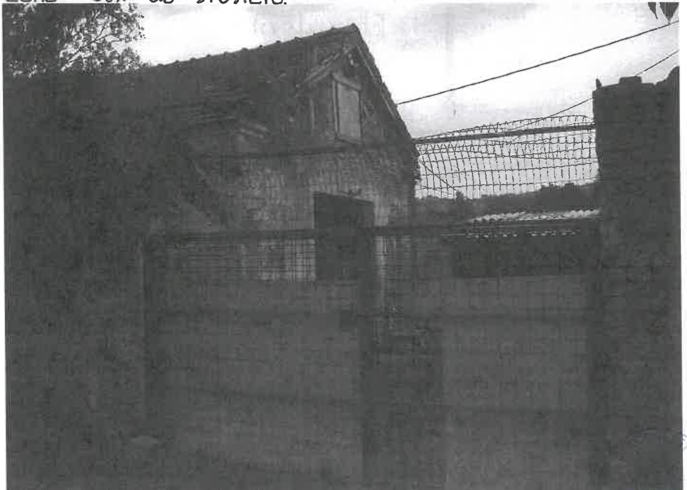
Fabbricato da ristrutturare Acqui Terme 16.10.2015