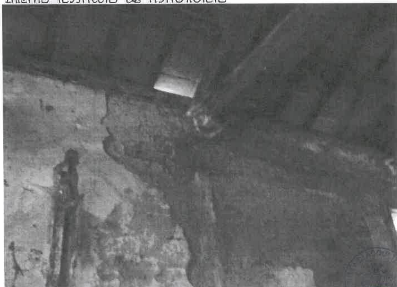
Interno fabbricato da ristrutturare. Acqui. Terme. 16.10.2015.