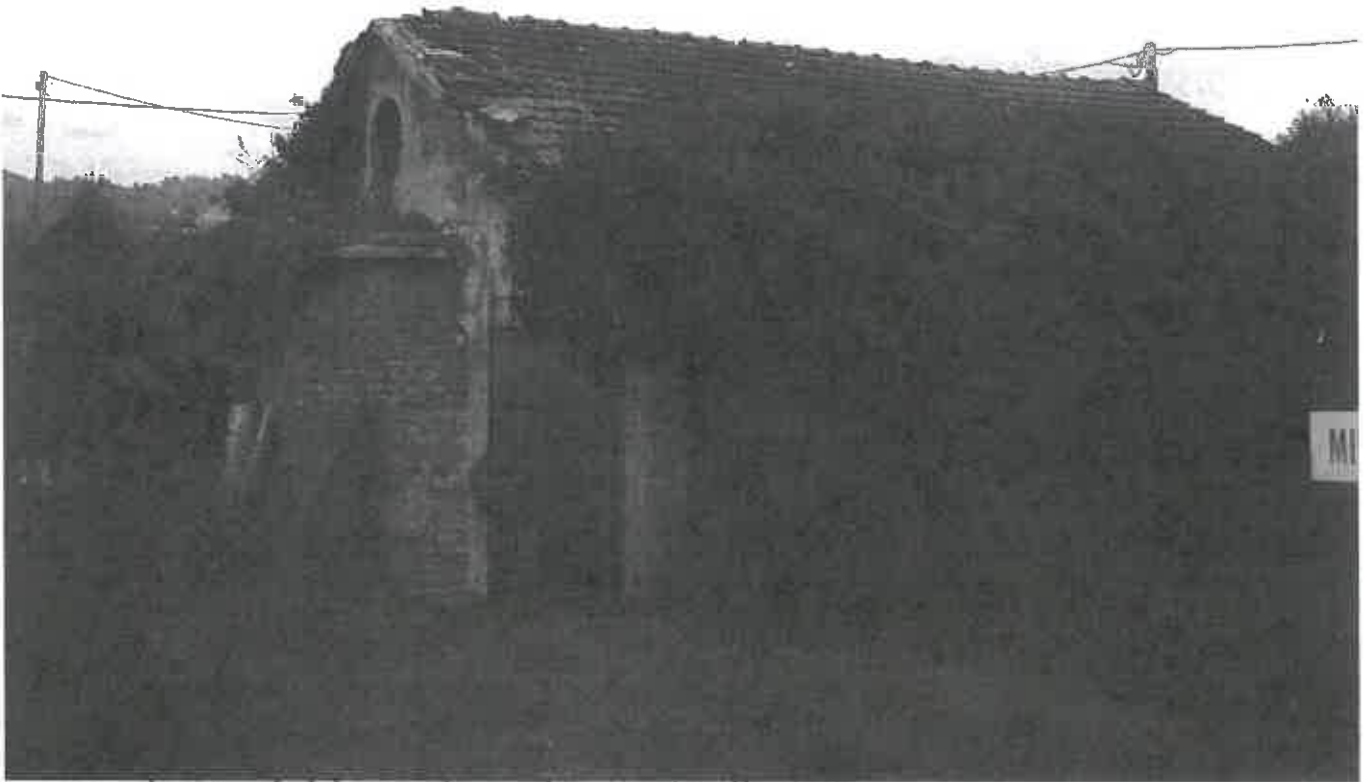
Copertura fabbricato da ristrutturare.